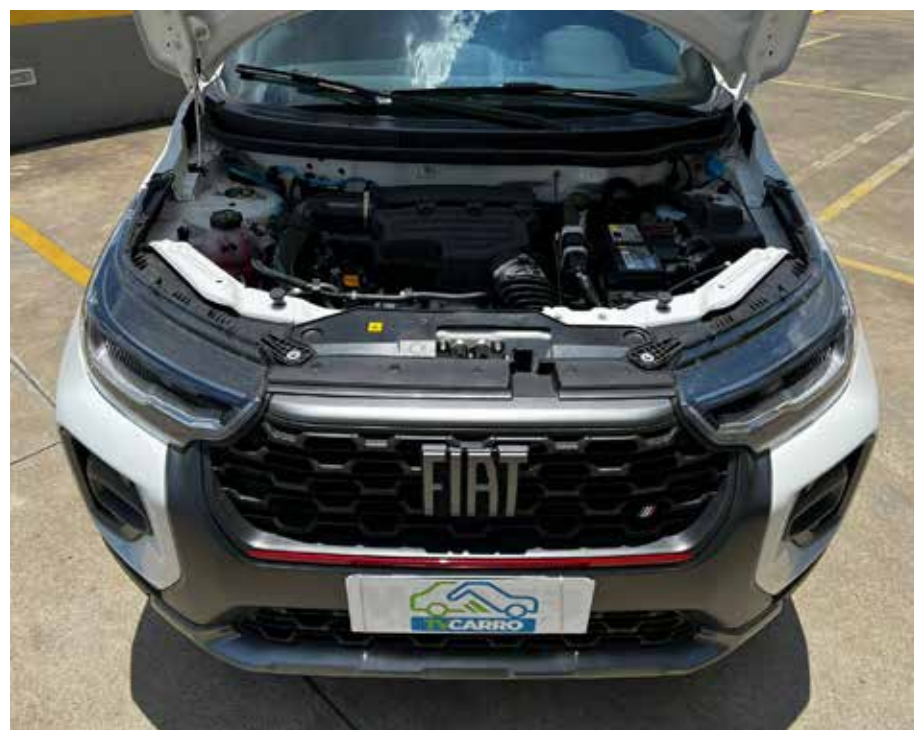
O motor é um 200 Turbo Flex de 130 CV