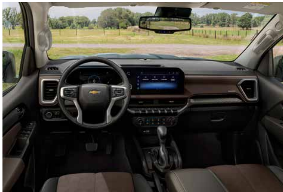
... também modificados e agrada