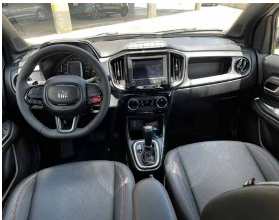
Interior com requinte nos acabamentos...

drões do mercado de picapes, oferecendo um equilíbrio excepcional entre desempenho, conforto e versatilidade. Com sua mais recente renovação, a picape Strada reafirma sua posição como a líder indiscutível do mercado brasileiro destaque para a versão Ultra.