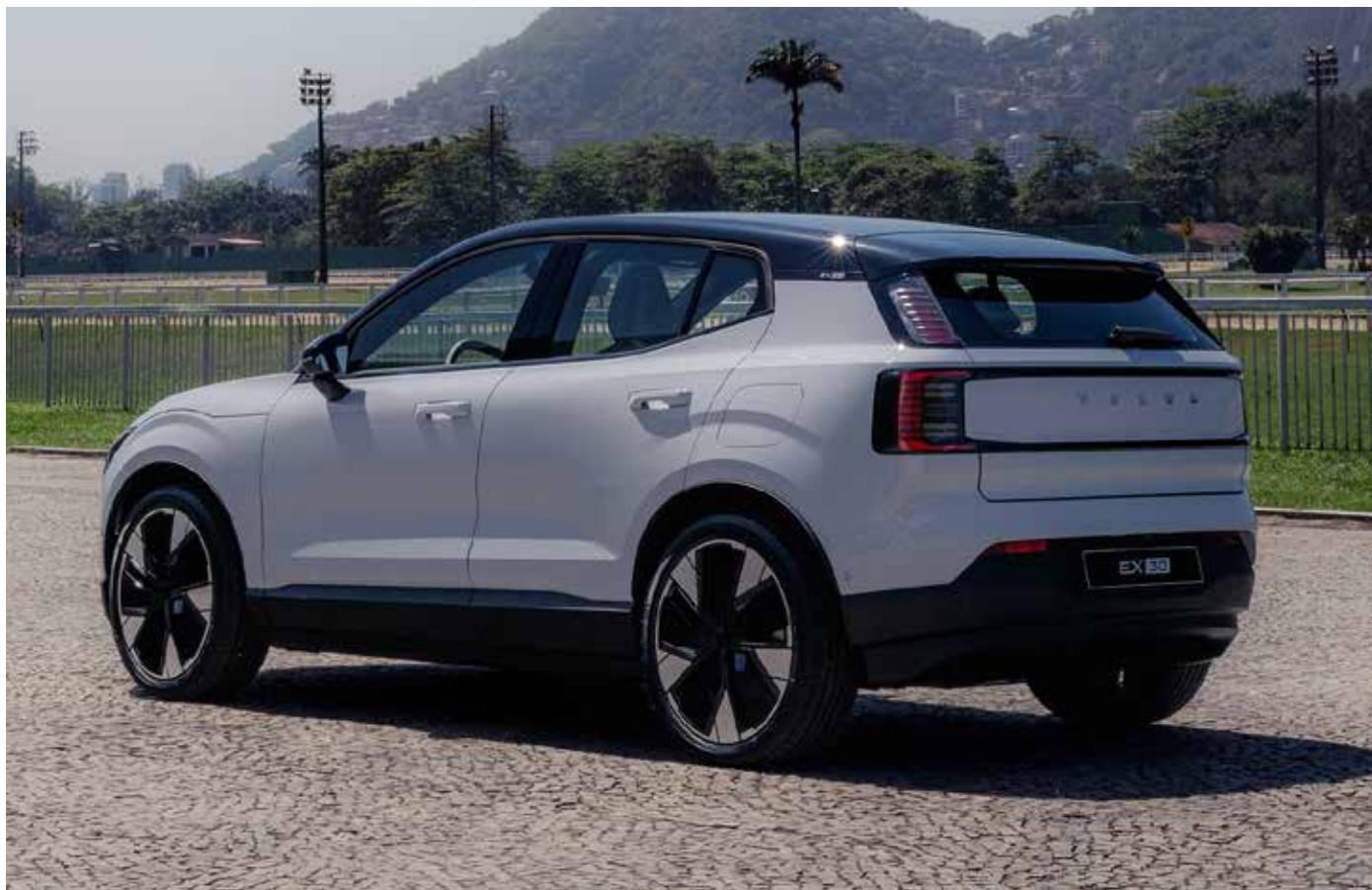
O EX 30 já agradou logo na pré-venda

“Este carro chega ao país para cumprir exatamente o papel esperado pela Volvo Cars. Ele chega revolucionando o setor automotivo e expandindo a eletrificação e a segurança da Volvo para um público ainda maior”, comenta