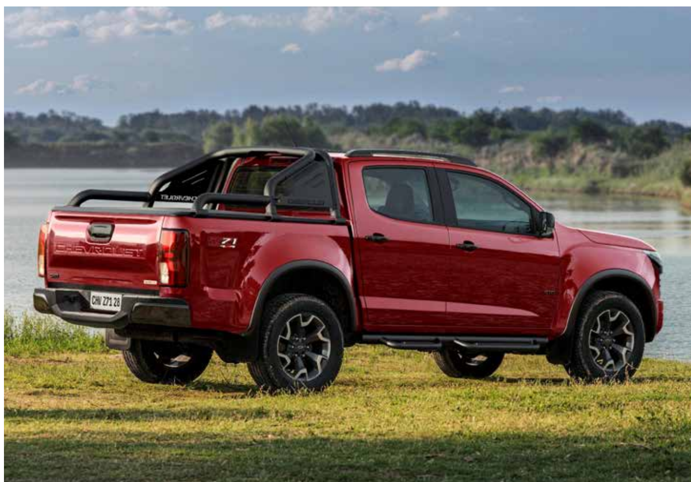
A traseira lembra a Montana

Esta nova iteração da S10 apresenta uma série de aprimoramentos significativos em termos de design, conectividade e mecânica, elevando-a a um novo patamar de excelência. A Chevrolet reforça o compromisso da S10 em oferecer o melhor equilíbrio entre trabalho e lazer, combinando conforto, robustez, força, eficiência energética e recursos