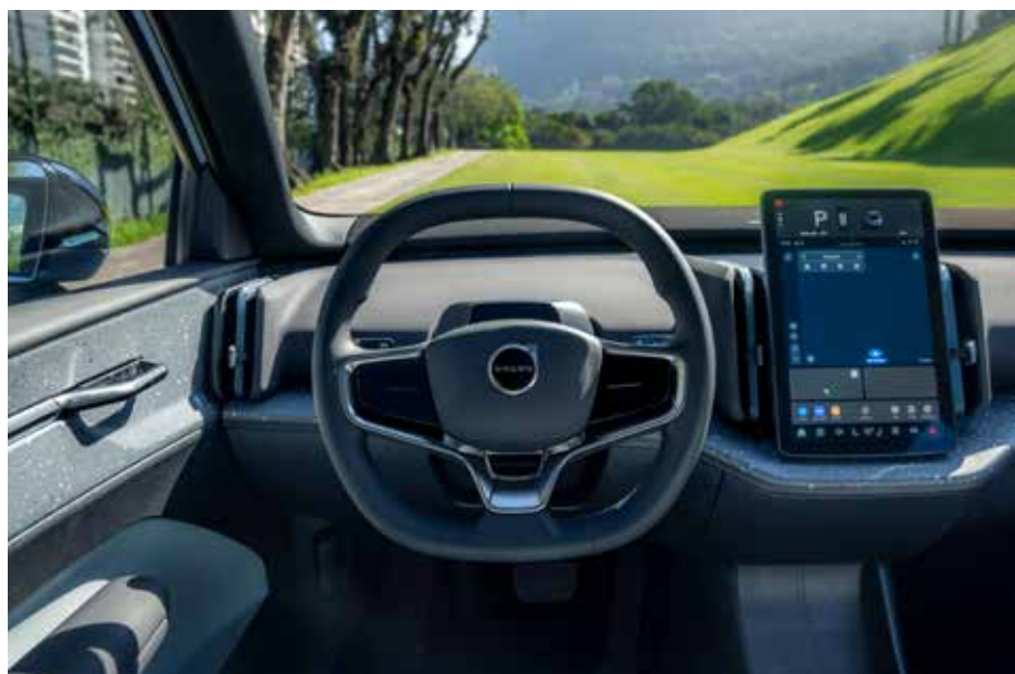
Interior traz muita tecnologia e uma central multimídia de 12,3 polegadas

O EX30 foi uma grande soma ao portfólio de produtos da marca, que no país comercializa somente modelos plug-in híbrido e elétrico. É o menor SUV que já foi lançado pela marca e foi construído com plataforma desenvolvida para carro elétrico. Além de ter emissão zero de carbono, foi desenvolvido com o foco de minimizar ao máximo a pegada de carbono durante todo o ciclo de