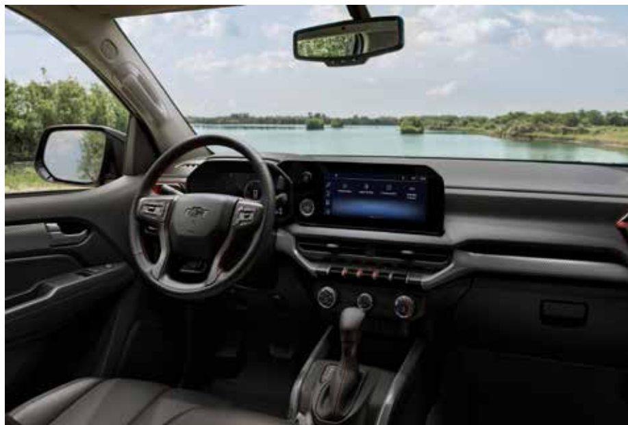
No interior das duas versões..