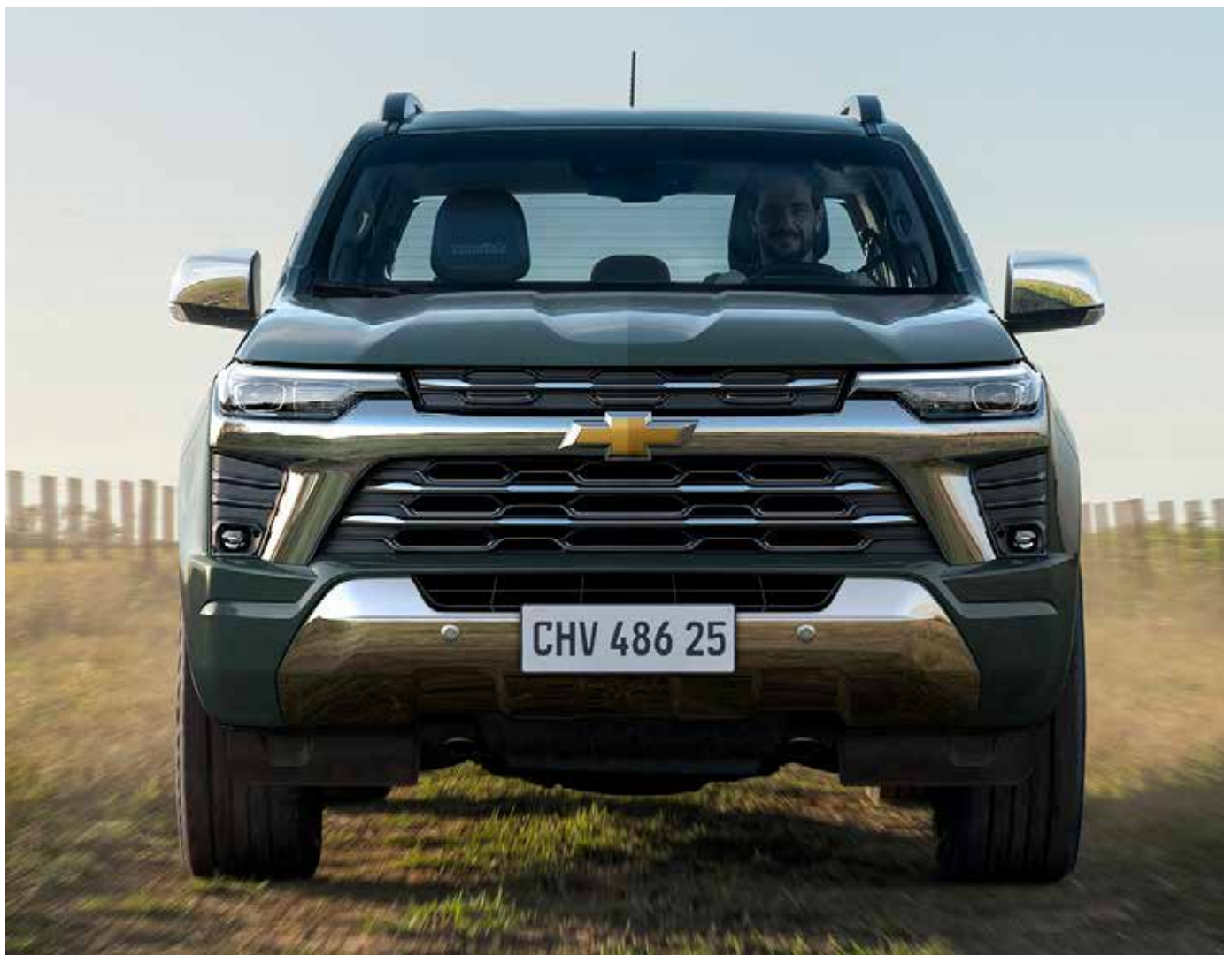
Frente toda renovada e com duas grades

Um dos pontos altos é a nova geração do motor turbodiesel, prometendo uma combinação revolucionária de performance, eficiência energética, emissões reduzidas e dirigibilidade sem precedentes no país. Além disso, junto com o lançamento da Nova S10, a Chevrolet está preparando mais quatro novidades para o mercado até o final deste ano, demonstrando seu compromisso contínuo com a inovação e excelência em seus produtos. Para quem gosta da marca fica a dica, já podem fazer a reserva nas concessionárias Chevrolet. Em breve aqui no WSN News mais detalhes sobre a picape.