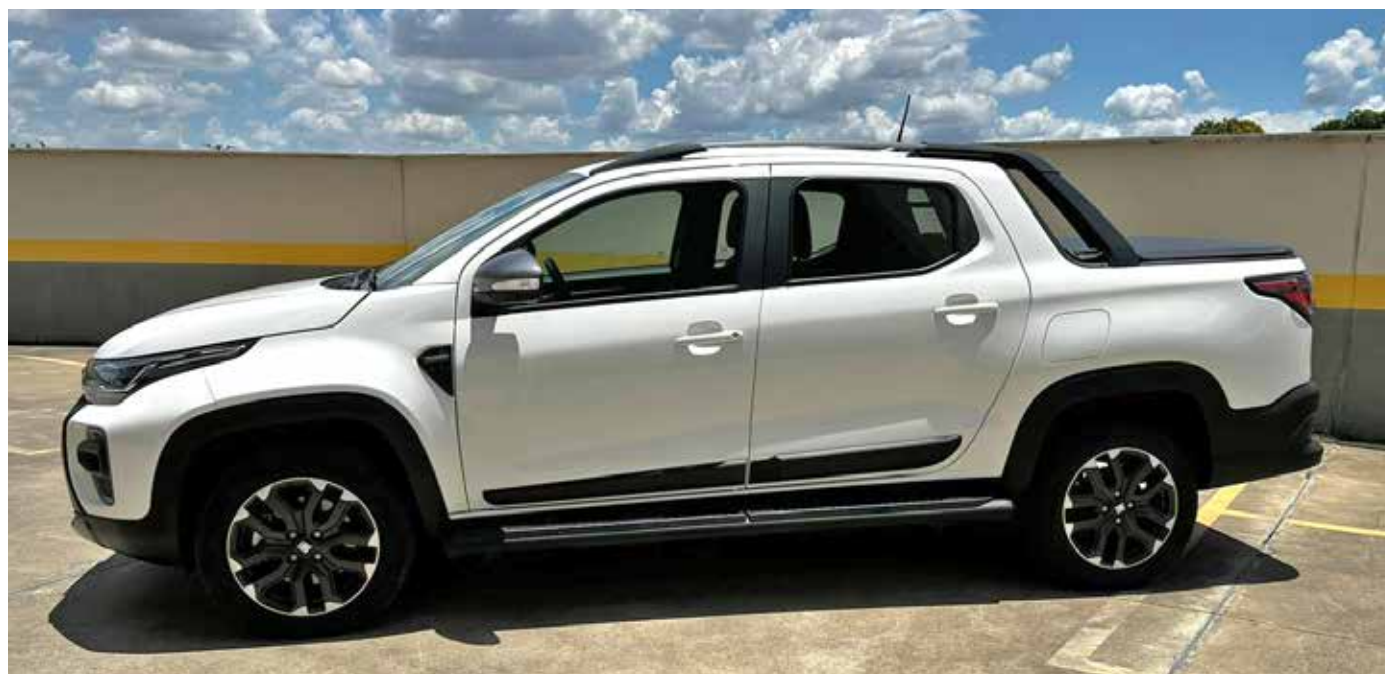
Visto pela lateral o santantonio se destaca

Além do seu desempenho impressionante, a Strada também prioriza a segurança e a tecnologia. Equipada com recursos como controle eletrônico de estabilidade, sistema Hill Holder e TC+ (Traction Control Plus), a picape oferece tranquilidade aos seus ocupantes em diversas situações de direção. O sistema multimídia UCONNECT 7 e o