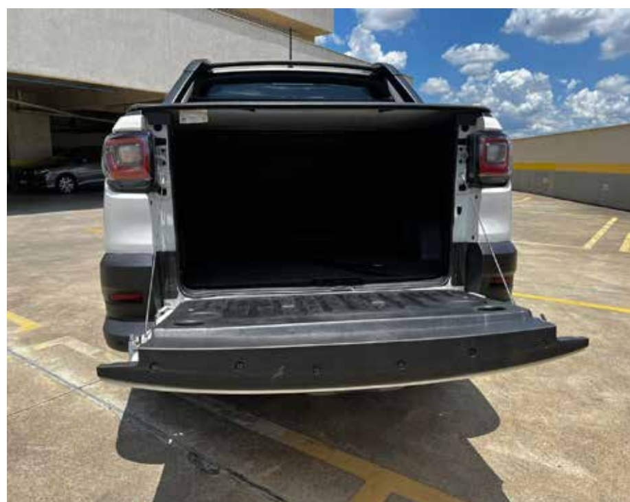
A caçamba com capacidade de 844 litros e 720 kg