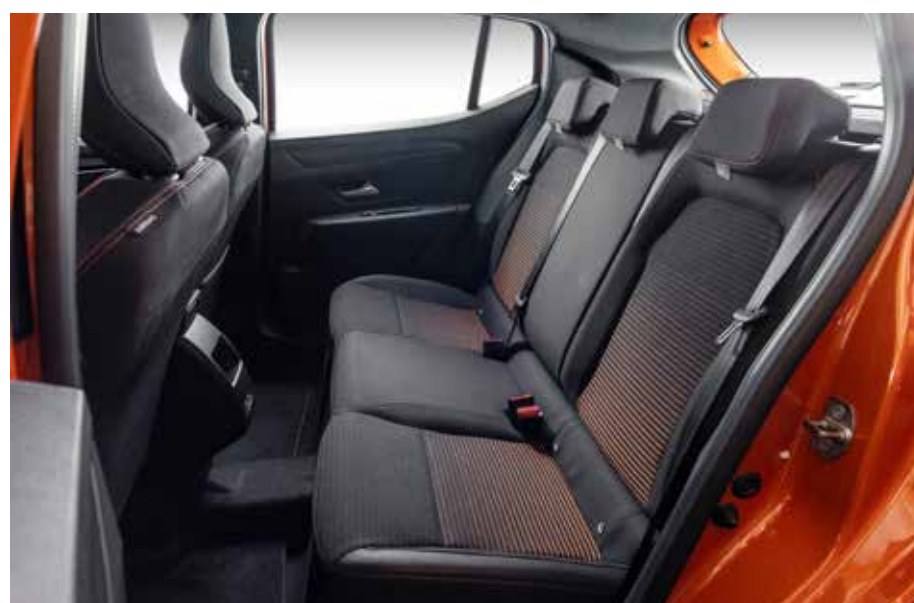
Espaço considerável aos ocupantes dos bancos traseiros