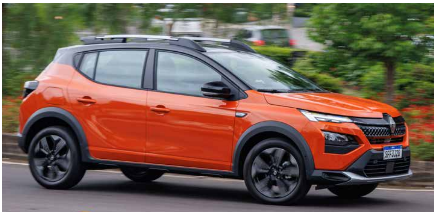
Com uma silhueta robusta e compacta ao mesmo tempo, o Kardian mistura linhas esculpidas e formas arredondadas com os elementos característicos dos SUVs como barras de teto

O interior do Kardian não fica atrás. Com um console central espaçoso e intuitivo, repleto de tecnologia e praticidade, e um sistema de iluminação ambiente personalizável, este SUV oferece um ambiente sofisticado e confortável para motorista e passageiros. Além disso, as inovações tecnológicas não se limitam ao design; o Kardian vem equipado com 13 sistemas avançados de assistência ao motorista (ADAS), garantindo uma experiência de condução mais segura e tranquila.