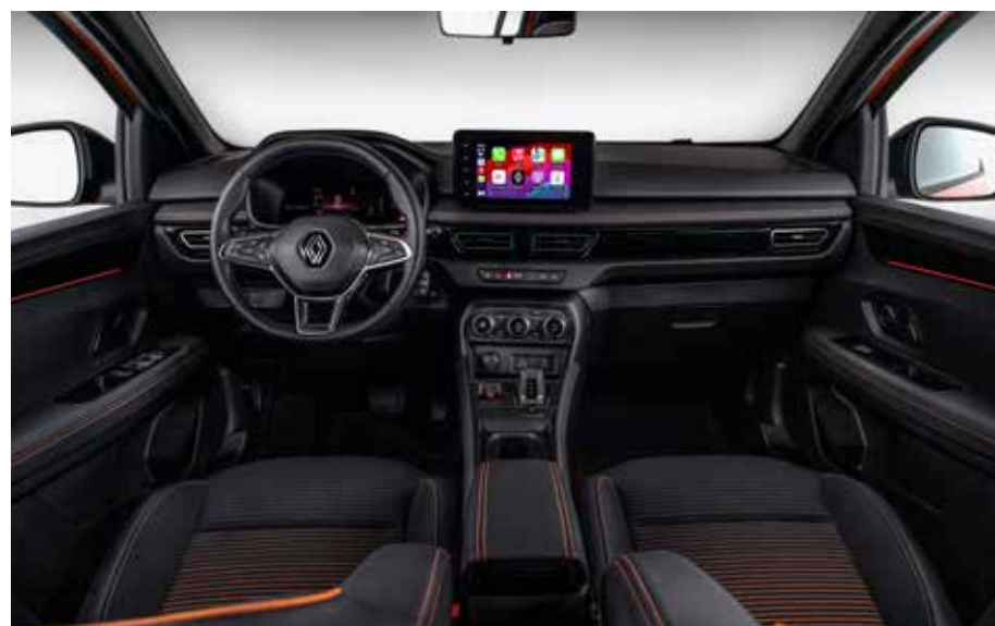
A central multimídia de 8" com design flutuante, a alavanca de marchas é do tipo “e-shifter” (sem acionamento mecânico), acionada por meio de um simples toque na manopla de comando

Mas o que realmente define o Kardian é o seu desempenho. Com o novo motor turbo TCe 1.0 flex, desenvolvido em parceria com a Daimler, este SUV oferece uma combinação impressionante de potência e eficiência. Além disso, o câmbio automático de dupla embreagem úmida proporciona uma condução suave e ágil, sem comprometer o