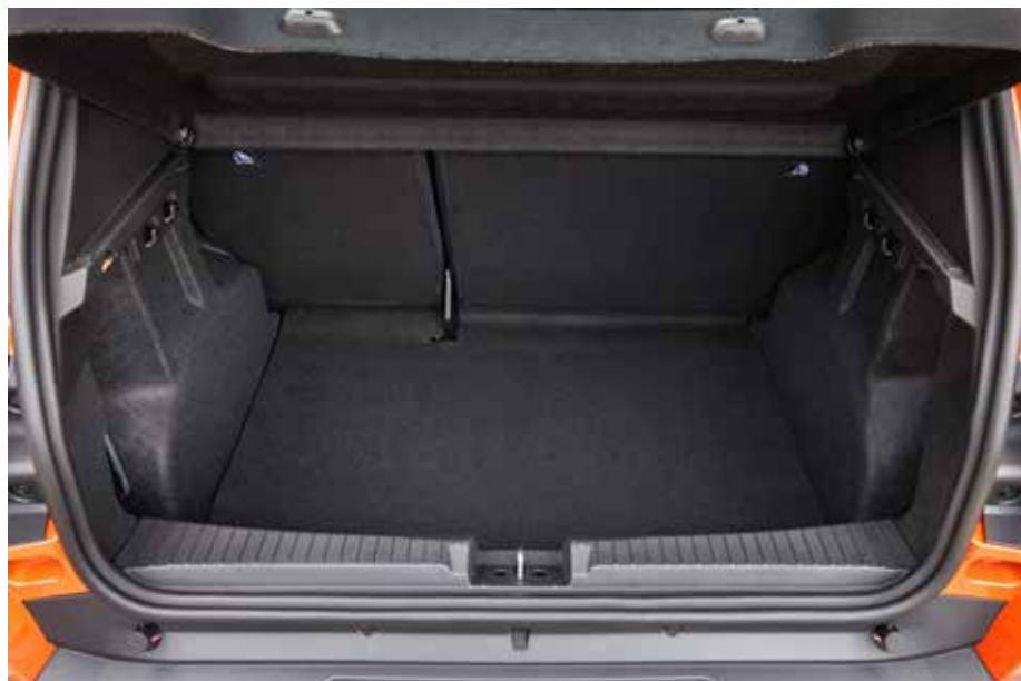
Com 358 litros (VDA), o volume do porta-malas é mais um dos pontos altos de sua versatilidade