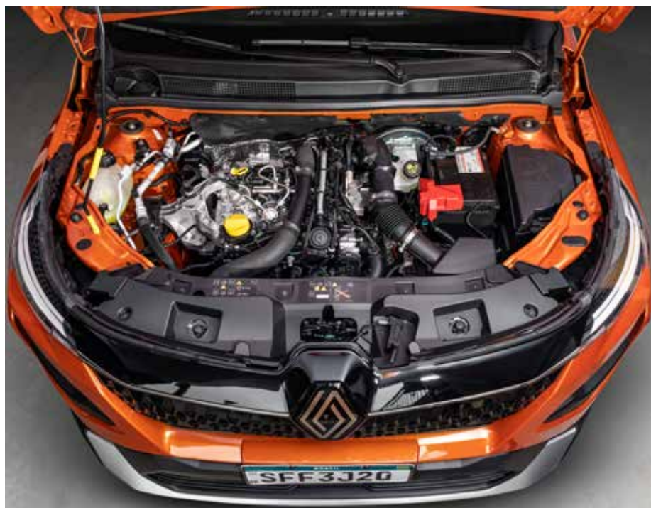
O novo motor turbo TCe 1.0 flex do Kardian faz parte da mesma família do motor turbo TCe 1.3 flex, desenvolvido em parceria com a Daimler