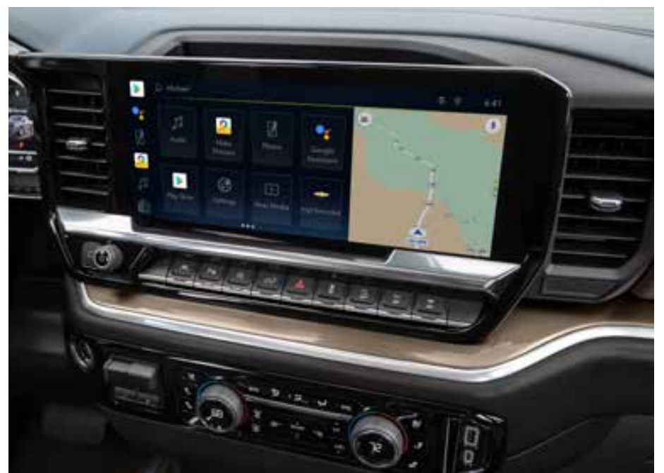
A picape se destaca ainda pelo painel digital configurável e pela multimídia de última geração com tela de 13,4 polegadas

A picape grande da Chevrolet conta com motor V8 (5.3L) a gasolina com um sistema inovador e inteligente, capaz de variar o número de cilindros em atividade conforme a condição, otimizando a relação entre aceleração, retomada e consumo. Trazendo também maior conforto acústico e de