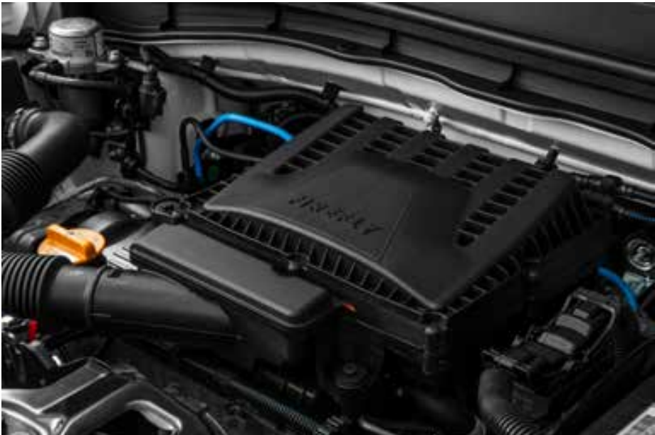
O Fiat Pulse 2024 mantém a motorização já existente na gama anterior do modelo, com destaque para o T270 do Abarth

e todas as novidades na linha 2024 tanto em Fiat quanto em Abarth, o Pulse vai conquistar ainda mais o coração dos brasileiros.