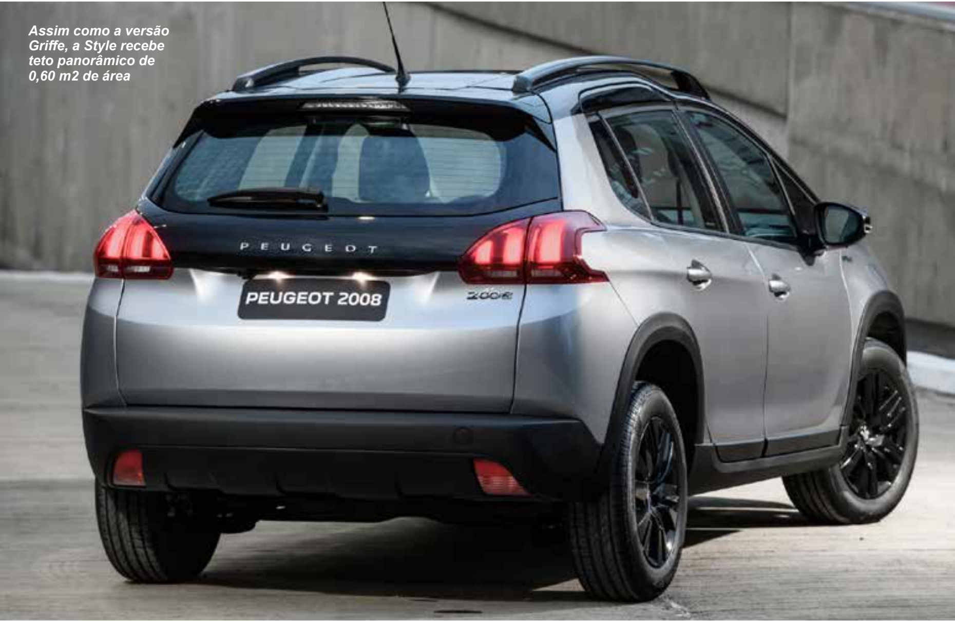
Assim como a versão Griffé, a Style recebe teto panorâmico de 0,60 m2 de área

A partir da versão Roadtrip os modelos contêm partes dos bancos em couro, rodas Aquila 16”, ar-condicionado bi-zone, lanternas traseiras em LED e farol com máscara negra. O Peugeot 2008 Style agora só está disponível com a reconhecida motorização turbo THP Flex de 173 cv com etanol e 165 cv com gasolina, classificado entre as mais potentes da categoria. A versão recebe na linha 2024 o teto panorâmico de 0,60 m², antes disponível somente na versão Griffé, o que proporciona um in-