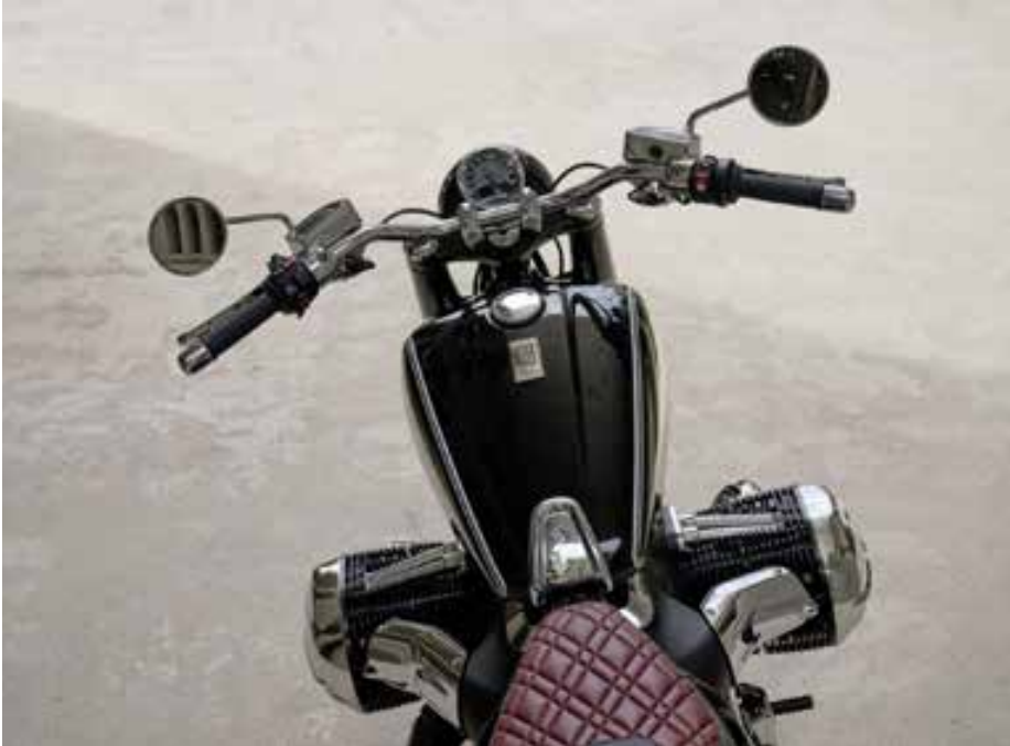
O câmbio é de seis marchas e os elementos de suspensão da nova BMW R 18 dispensam ajuste eletrônico