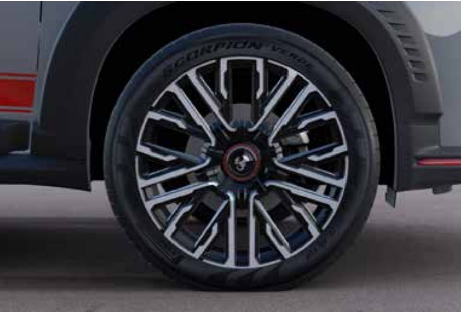
O Pulse Abarth agora tem também a opção pela rodas escurecidas de 18 polegadas, com desenho exclusivo