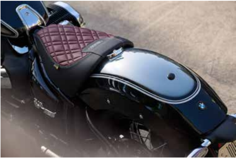
O banco tem acabamento bi-tom, combinando preto com vermelho Oxford e reforçando o caráter exclusivo do modelo

partidas em subidas, controle de velocidade de cruzeiro, todas as luzes em LED e sistema de partida sem chave.#