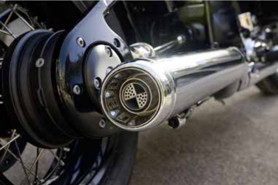
Para definir o exclusivo ronco que se ouve no segmento, o escapamento das moto é assinado pela renomada Akrapovic