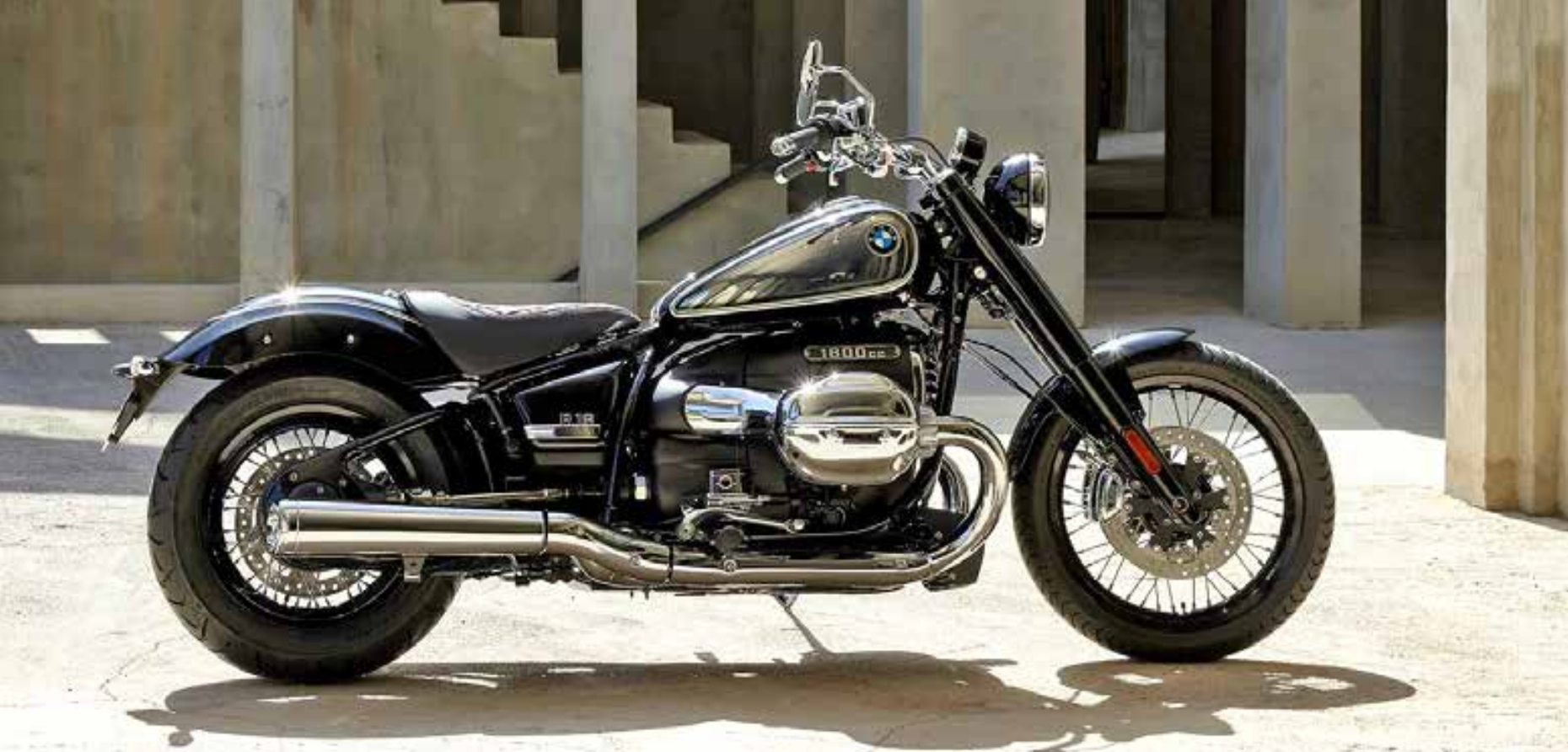
A moto possui um motor boxer de 2 cilindros, desenvolvido para esse modelo. Com 91 cv a 4.750 rpm de potência e 158 Nm de torque a 3.000 rpm, o motor ainda tem um belíssimo ronco

trado no para-lama da roda traseira em combinação com a linha dupla branca.