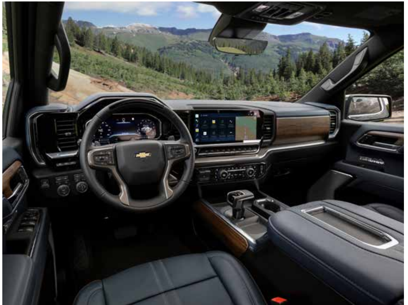
Sem a necessidade de conexão com smartphones, o sistema Google Built-in conecta-se automaticamente ao perfil digital do usuário para importar da nuvem os apps preferidos

É possível estabelecer diversos perfis, um para cada motorista. Há inclusive um Modo Mano-