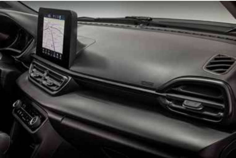
O conceito S-Design oferece central multimídia de 10,1" com navegação GPS embarcada, wireless charger e keyless Entry'nGo