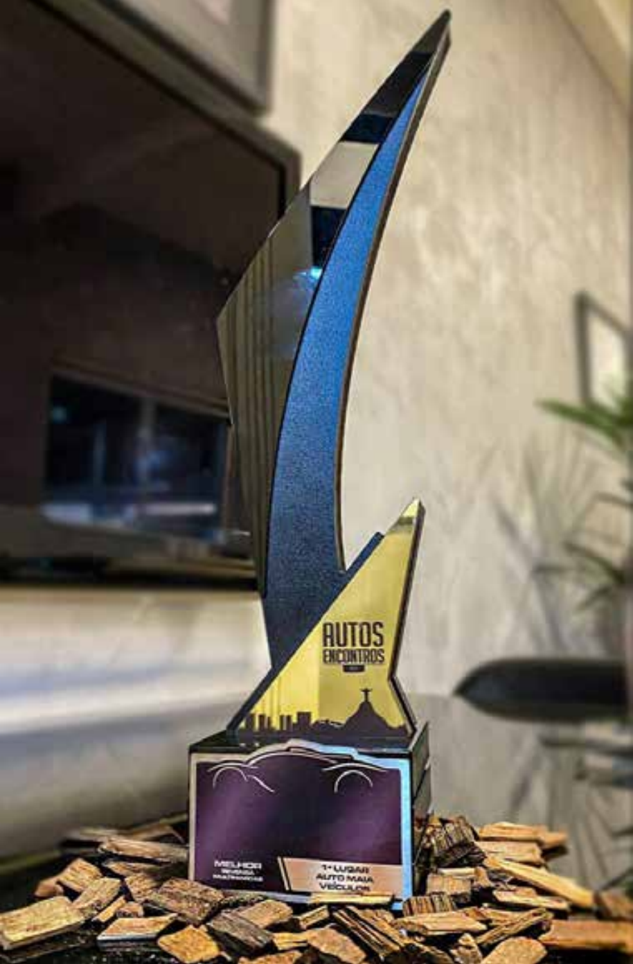
O troféu de melhor loja do Brasil representa o reconhecimento de 55.596 votos na categoria de seminovos entre 3.825 inscritos