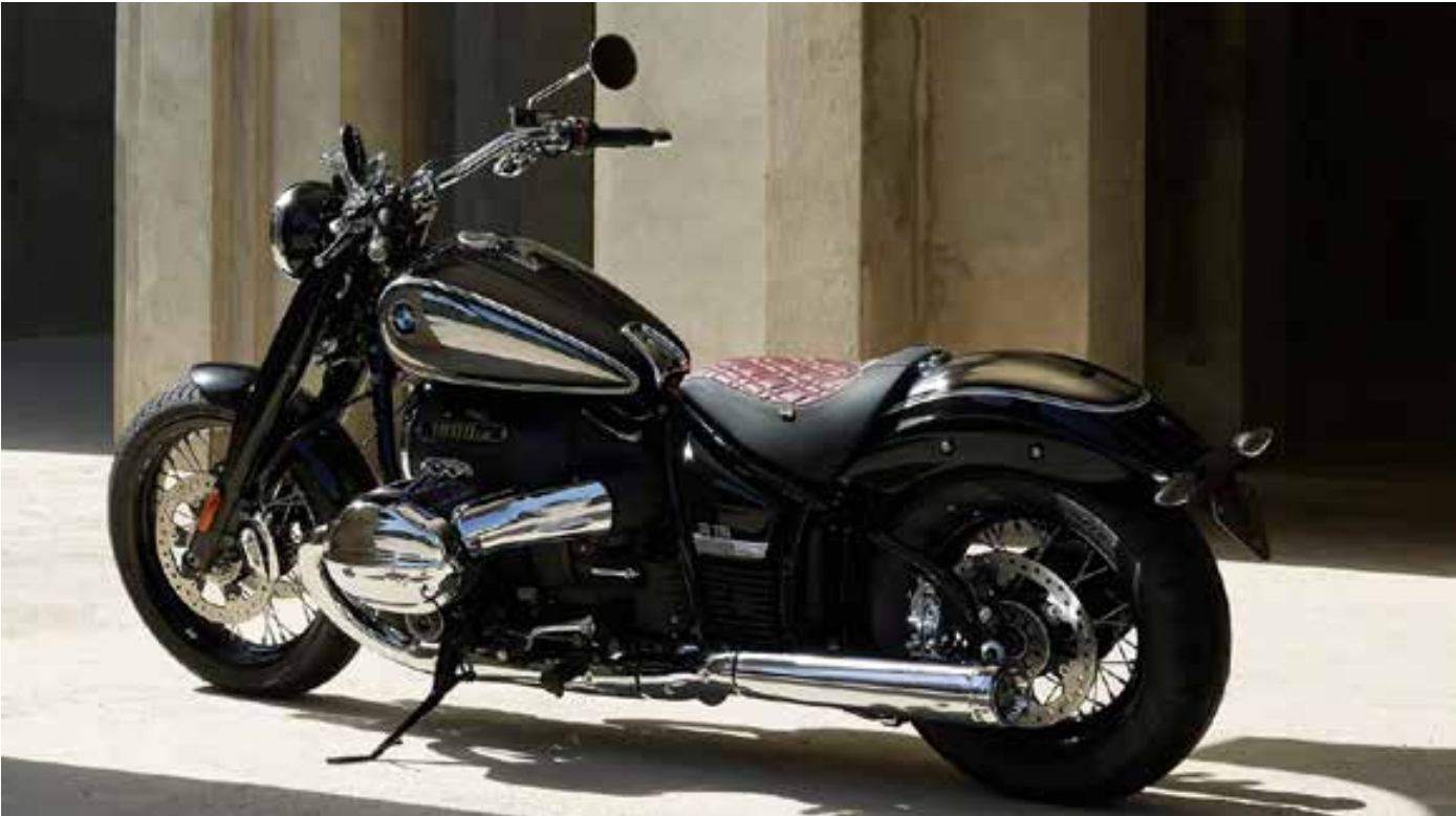
A combinação de cores da BMW R 18 - 100 Anos alia pintura preta e superfícies cromadas de alto brilho, bem como linhas brancas duplas e um emblema “100 Anos”

P ara quem curte uma moto ‘pra lá de especial’ e de produção reduzidíssima, já se encontra no mercado nacional a edição comemorativa pelos 100 anos da BMW Motorrad, a BMW R 18 - 100 Anos. A moto já está com as manoplas ao alcance desses motociclistas brasileiros, desde que possuam saldo bancário que disponham de pelo menos R$ 189.900. Isso porque a moto já está à venda nas concessionárias nacionais, somente com 30 unidades das 1.923 unidades produzidas — o que requer alta velocidade para os que desejam pilotar a Cruiser, inspirada na clássica BMW R 5, dos anos 30 do século passado. Com linhas clássicas e estilosas e o maior motor boxer já produzido na história da BMW Motorrad, a