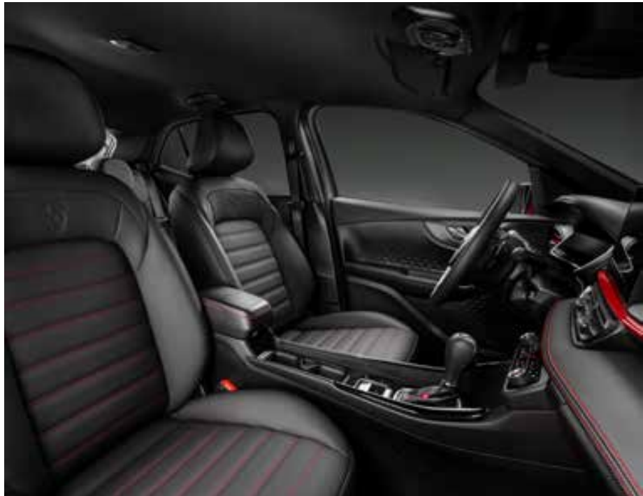
Os bancos de couro são anatômicos e muito bem dimensionados, com realce das costuras na cor vermelha na versão Abarth